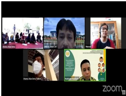
Gambar 1. Pembukaan oleh Dekan

Pembukaan oleh Dekan beserta sebagian Tim melalui Zoom, mengingat kondisi pandemic Covid-19 yang masih berkecamuk dan harus memenuhi protocol kesehatan, menjaga jarak, memakai masker, membatasi jumlah kerumunan, mencuci tangan. Kegiatan tersebut dapat dilihat pada foto berikut.