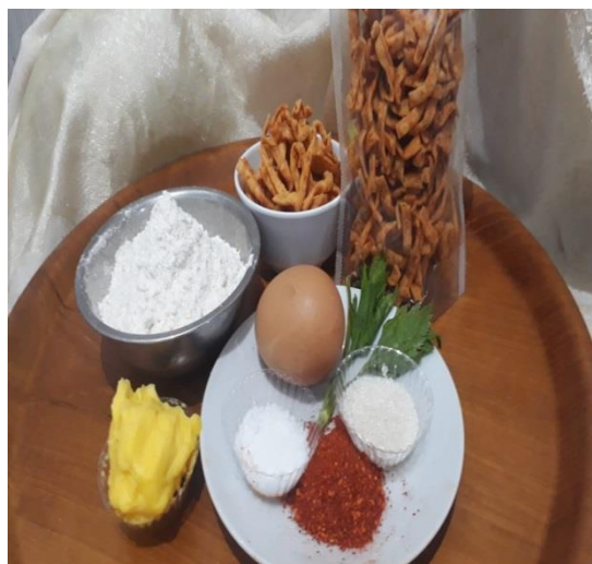
Gambar 11. Hasil stik Cabe