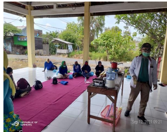
Gambar 6. Tanya Jawab