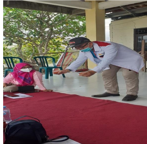
Gambar 8. Menunjukkan hasil Demo