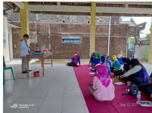
Gambar 2. Ketua Tim di Lokasi