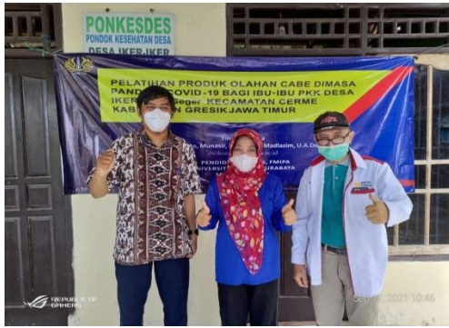
Gambar 3. Tim beserta Mitra 1