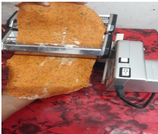
Gambar 9. Proses Menggiling Stik

Hasil Olahan produk dari komoditas berbahan dasar Cabe seperti Abon Cabe, Berbagai jenis Sambal Cabe, stik cabe, berkedel cabe, saus cabe, bubuk cabe, pasta cabe dikemas dalam berbagai botol yang higienis atau dengan kantong plastic yang diklem dengan tekanan dan panas tertentu dengan alat khusus (Iskandar, 2016).