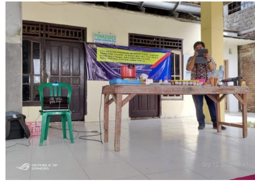
Gambar 4. Anggota Tim mendokumentasi