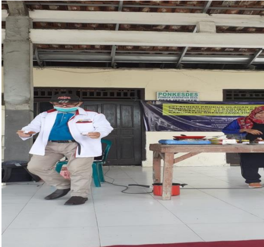
Gambar 7. Demonstrasi bersama mitra