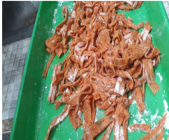
Gambar 10. Stik cabe diiris2