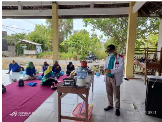
Gambar 5. Ceramah Interaktif

Peserta pelatihan dapat bertanya jawab di sela-sela tim menyampaikan seluk beluk pengolahan cabe dan berbagai variasinya. Bertanya jawab seputar pengalaman yang pernah dilakukan, contoh-contoh yang ada dan kemungkinan variasi-variasinya. Produk olahan yang ada dalam berbagai macam kuliner yang memakai bahan cabe.