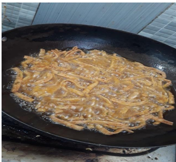
Gambar 11. Stik Cabe digoreng