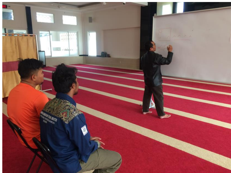
Gambar 4. Pelatihan penggunaan perangkat multimedia